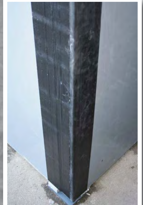
Hjørnesamling vises med Proofex L-section/ Proofex Detail Strip.