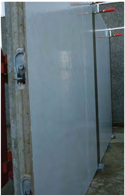
Element med Proofex Engage. Samling vises med Proofex Detail Strip.