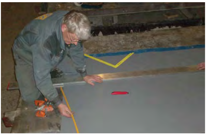
Proofex Engage opmåles og tilskæres.