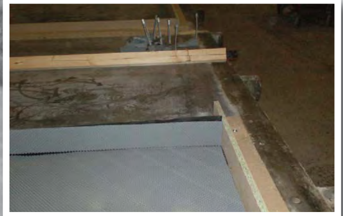
Proofex Engage monteres i støbe- formen til hjørne- elementet.