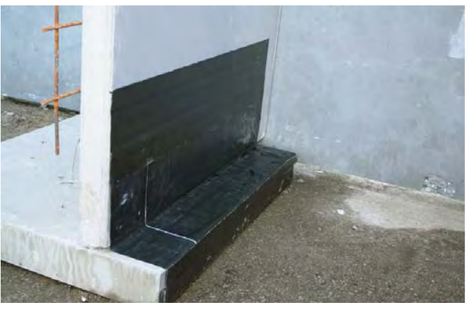
Filigranelement / element - Løsningsforslag til tætning af element/fundament med fredsring udført med Proofex 3000 og Proofex Detail Strip.