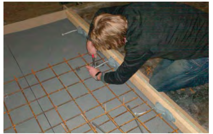
Armeringsjern og afstandsstykker tilpasses i støbeformen.